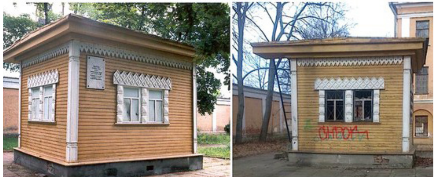
● «Эволюция» лаборатории Попова

Сегодня отмечается Всемирный день радиолобителя. Спросите жителей России: кто изобрел радио? Они ответят – Александр Попов. Спросите итальянцев, и они скажут – Маркони. До сих пор ученые спорят: кого считать изобретателем радио? Наши повсеместно отстаивают это право в пользу Попова. Но как можно добиться признания во всем мире, если даже в собственной стране мы не способны достойно чтить его память?